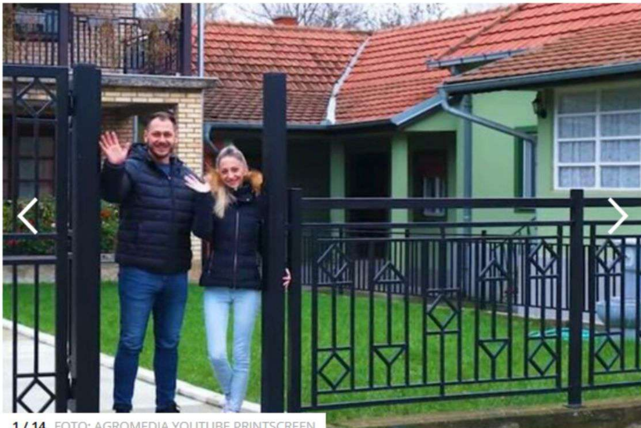
1 / 14