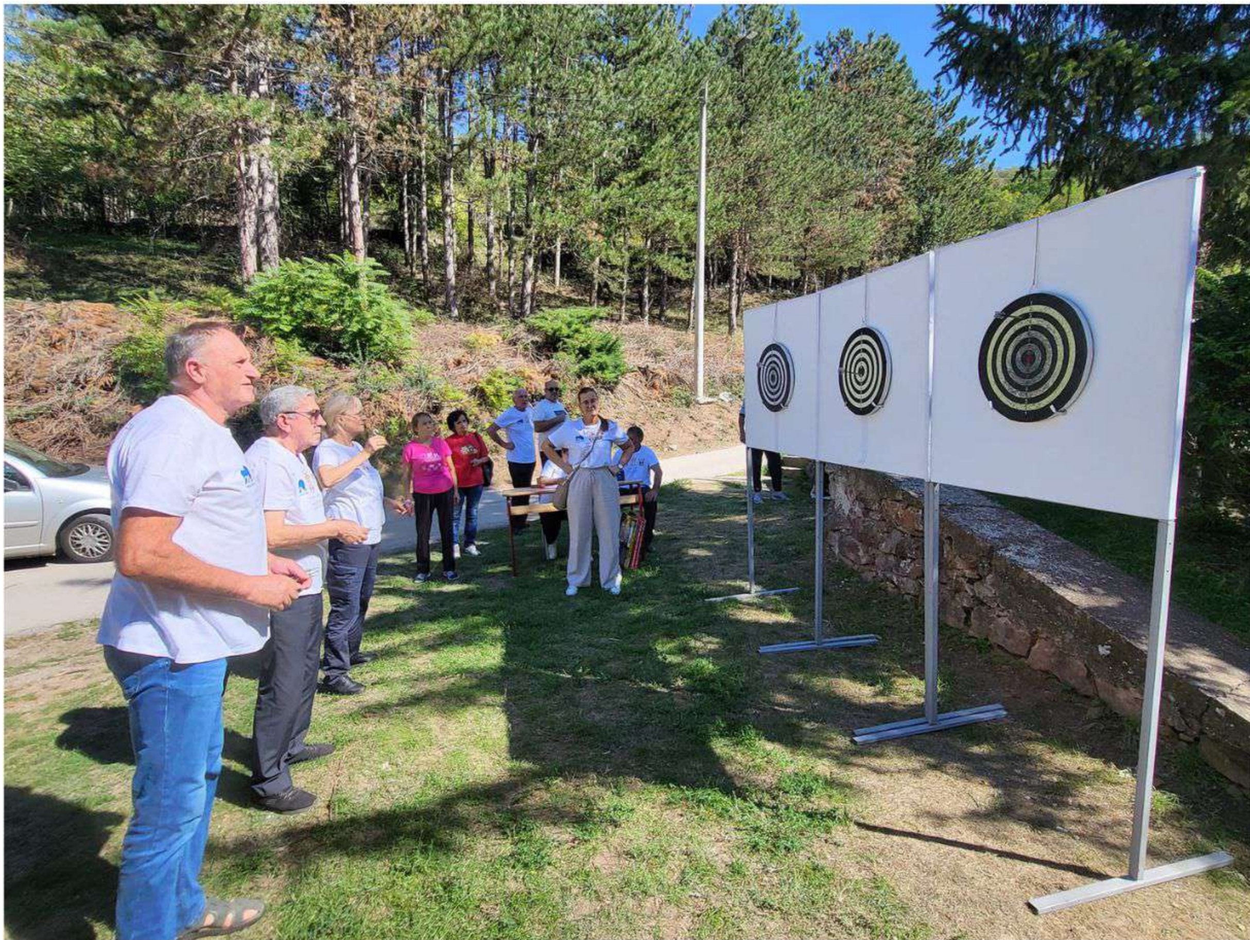
Miholjski susreti foto: GP018

Miholjski susreti sela nisu samo prilika za okupljanje, već i način da se istaknu najlepši aspekti ruralnog života.