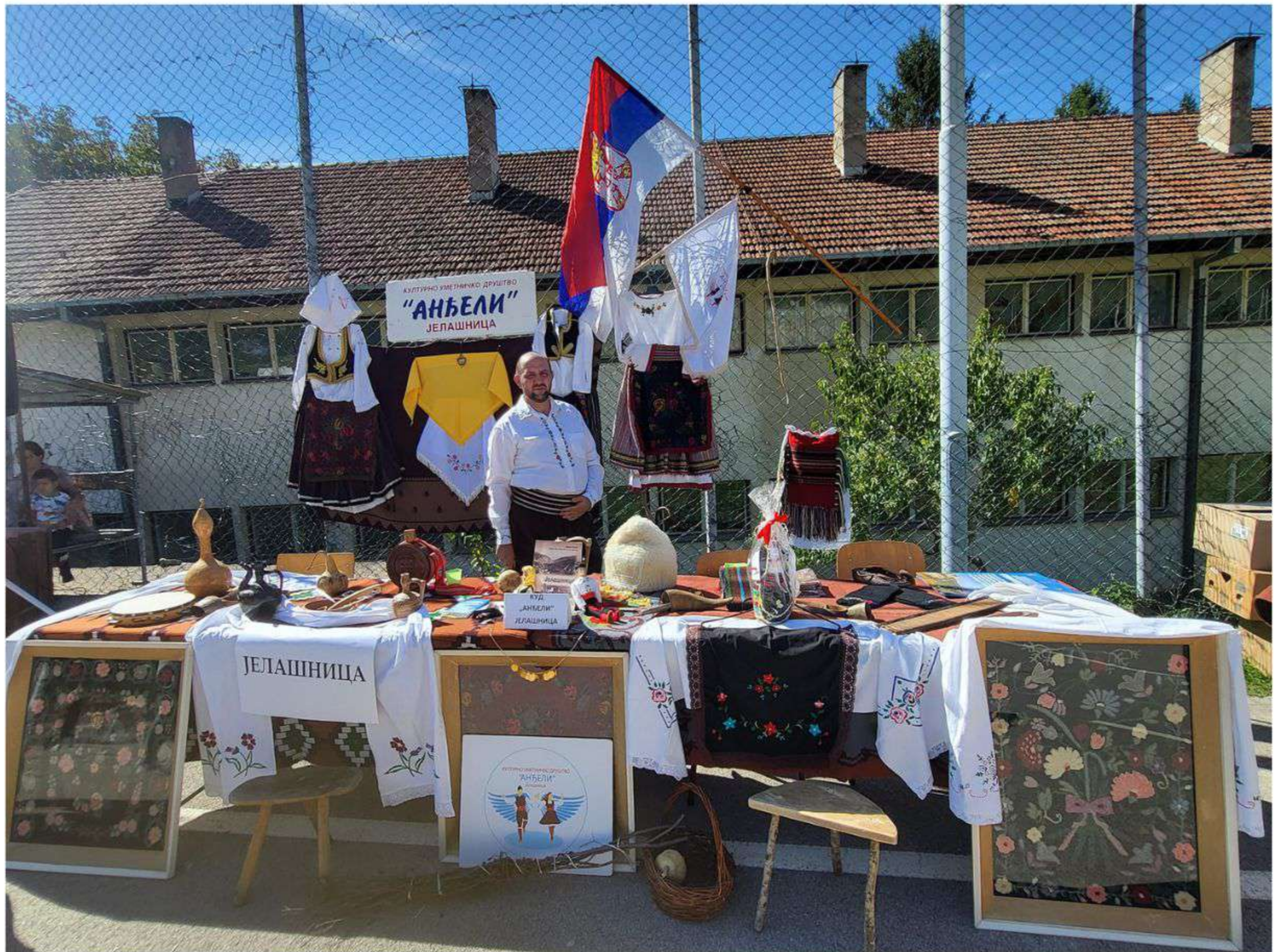
Miholjski susreti

Ona je podvukla da su sredstva za organizaciju manifestacije obezbeđena kroz saradnju sa Ministarstvom za brigu o selu, što ukazuje na sveobuhvatnu podršku vlasti za razvoj sela.