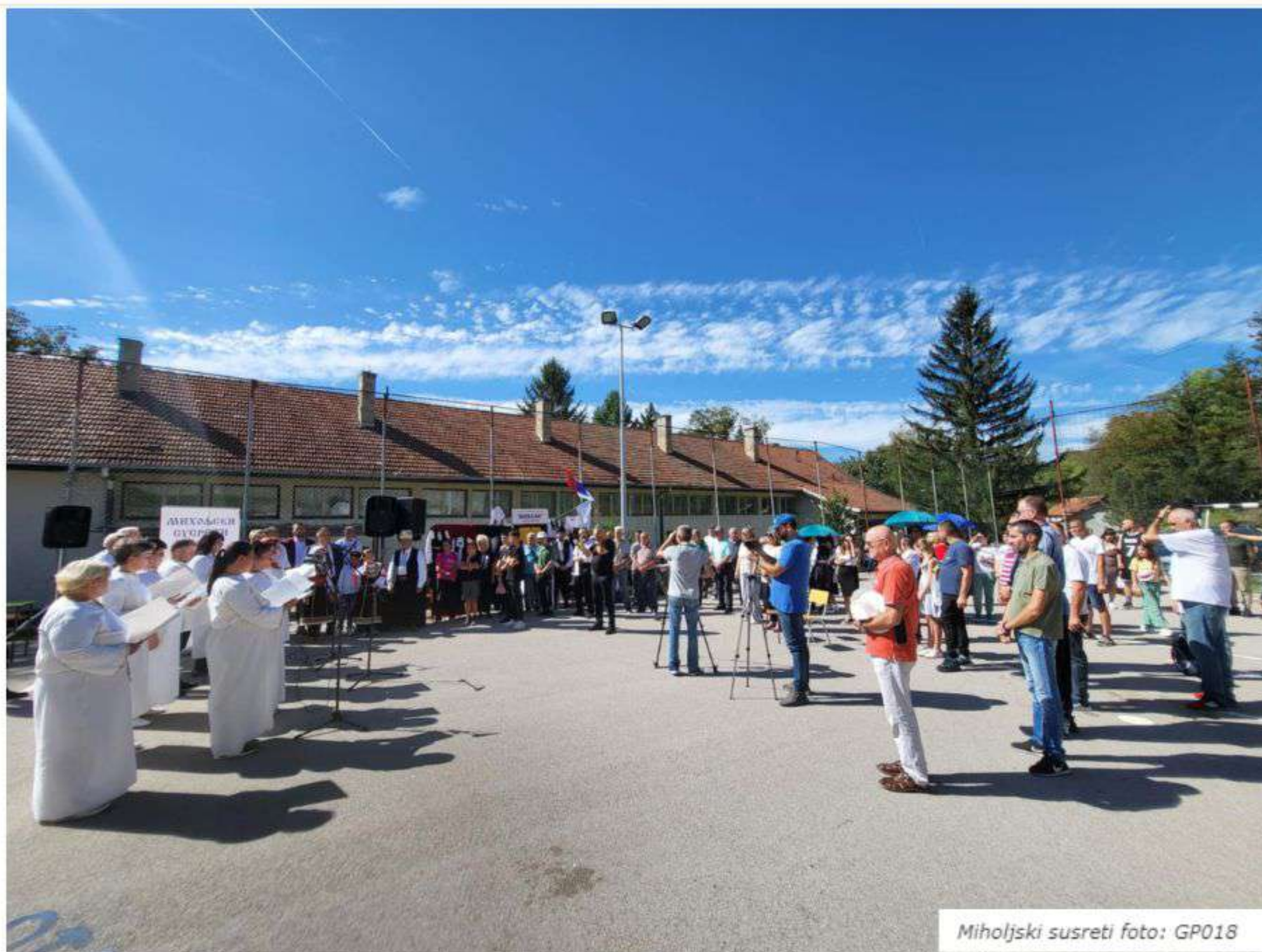
Miholjski susreti